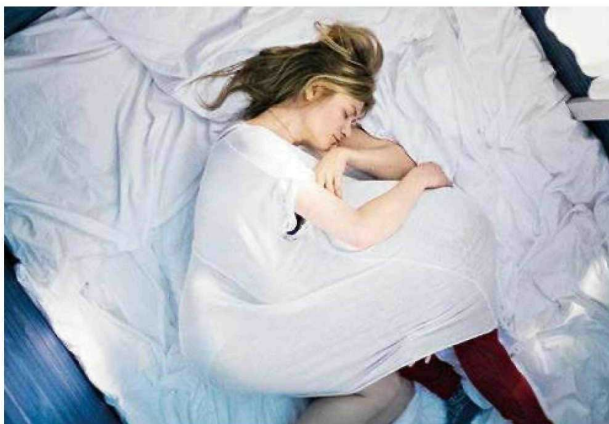
Berührend und bedrückend: „24 Wochen“ schaut hin, wo viele gerne wegschauen würden