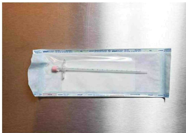
Mit dieser Kanüle wird Kaliumchlorid ins Herz des Babys gespritzt. Wenn das Herz stillsteht, wird die Geburt eingeleitet