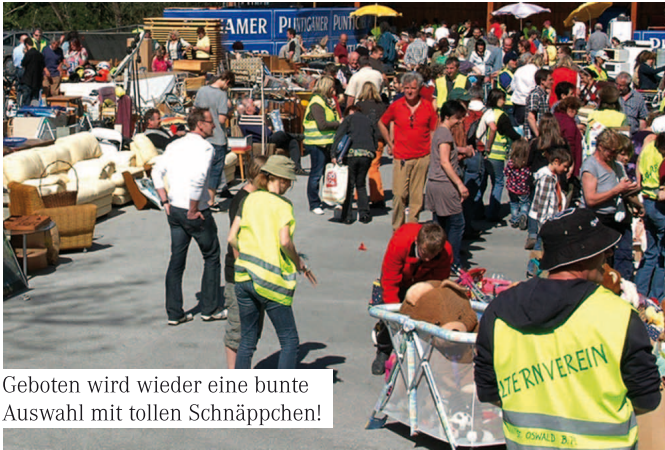
Geboten wird wieder eine bunte Auswahl mit tollen Schnäppchen!

Der Elternverein der Volksschule St. Oswald bei Plankenwarth zeichnet sich durch besonderes Engagement aus.