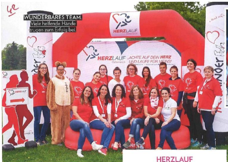
WUNDERBARES TEAM. Viele helfende Hände trugen zum Erfolg bei.