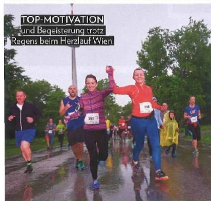
TOP-MOTIVATION und Begeisterung trotz Regens beim Herzlauf Wien.