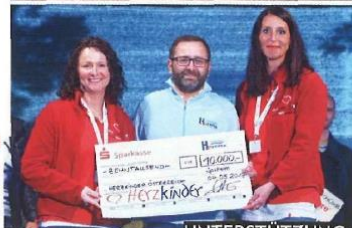
UNTERSTÜTZUNG. H. Preis International überreichte dem Verein Herzkinder Österreich einen Spendenscheck in Höhe von € 10.000,-.