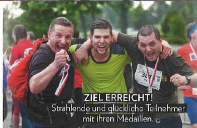
ZIEL ERREICHT! Strahlende und glückliche Teilnehmer mit ihren Medaillen.