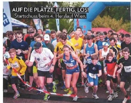
AUF DIE PLÄTZE, FERTIG, LOS! Startschuss beim 4. Herzlauf Wien.