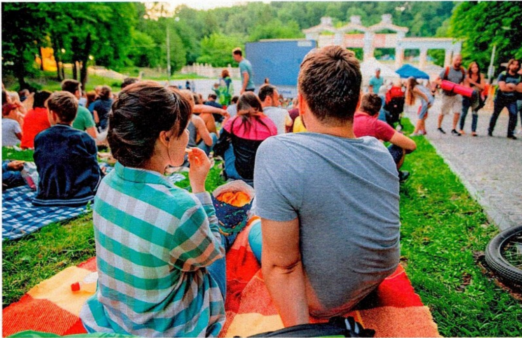
Picknickdecke, Kulinarik und nette Gesellschaft: perfekte Zutaten zum Filmschauen im Freien.