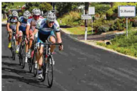
339 Teilnehmer stellten sich heuer der Herausforderung „Sawaldman“. Dabei mussten die Starter unzählige Höhenmeter bewältigen.