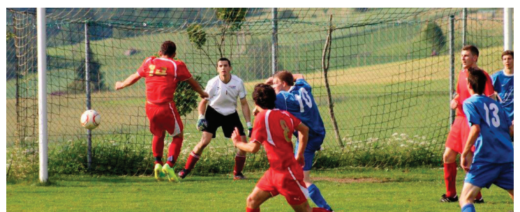
Die SV Urfahr 1912 feiert ihr 100-jähriges Bestehen. Natürlich wird deswegen auch Fußball gespielt.

ten dem Stürmer, der sich mit 20 Volltreffern den Titel des Torschützenkönigs der BezirksrundschauLiga-Nord sichert. Seinem Verein bleibt er übergangslos treu.